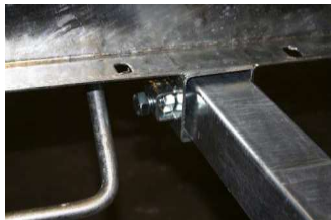
Hur infästningen till tvärstaget skall sitta