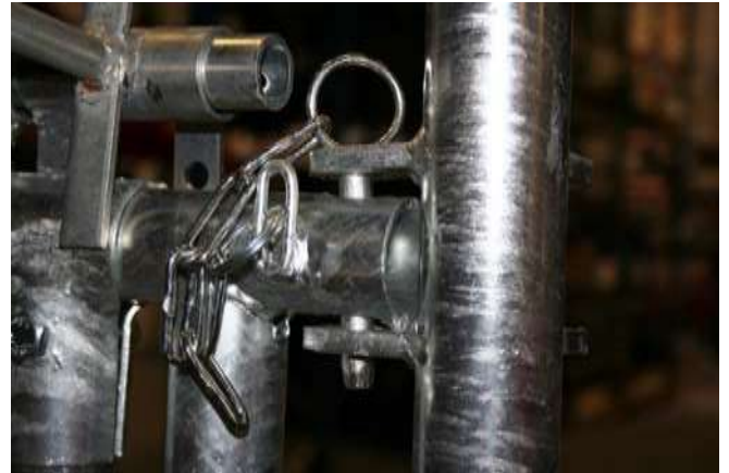
Låsning av front med bult – vänster sida