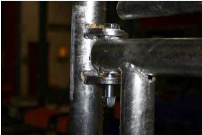
Låsning av front med bult – vänster sida