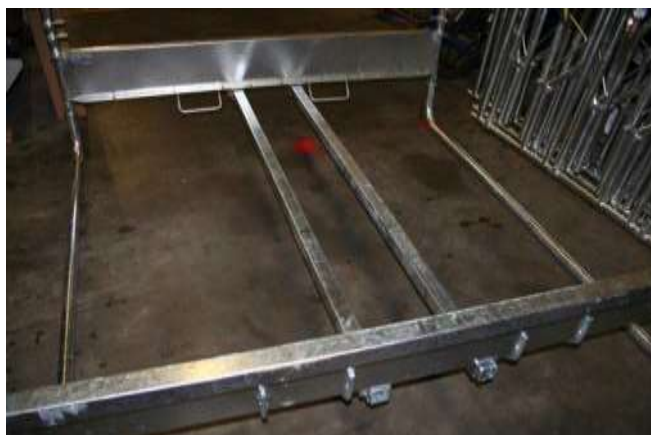
Montera ben och stolpar. OBS. Tänk på stolparnas vridning och placering.