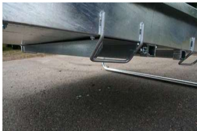
Hur pallgaffelkanalerna skall se ut när de sitter på plats.