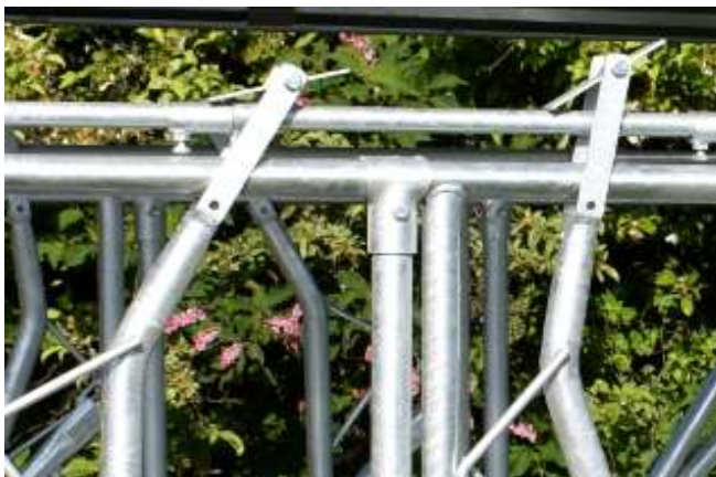
Låsning med separat bygel